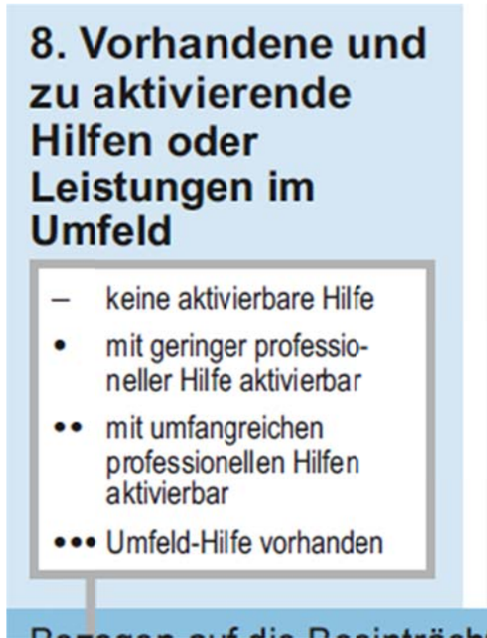
Abbildung 13: Vorhandene und zu aktivierende Hilfen im Umfeld

Die Spalte „Vorhandene und zu aktivierende Hilfen im Umfeld“ trägt dem fachlichen Grundsatz der Nachrangigkeit professioneller Hilfen und der Vorrangigkeit von Hilfen in natürlichen Netzwerken Rechnung. Hier sollen Sie möglichst gemeinsam mit Sorgeberechtigten und ggfs. Kindern einschätzen, ob Hilfen zu den konkreten Fähigkeiten und Beeinträchtigungen im Umfeld entweder schon geleistet werden bzw. mit Fachkraft-Hilfe zu erschließen wären. Dieses „Erschließen“ betrifft zum einen die Frage, ob durch professionelle Begleitung und Beratung „natürliche“ bürgerschaftliche Hilfen zu aktivieren sind und ob ggfs. eine Leistung zur Unterstützung dieser vereinbart werden kann.